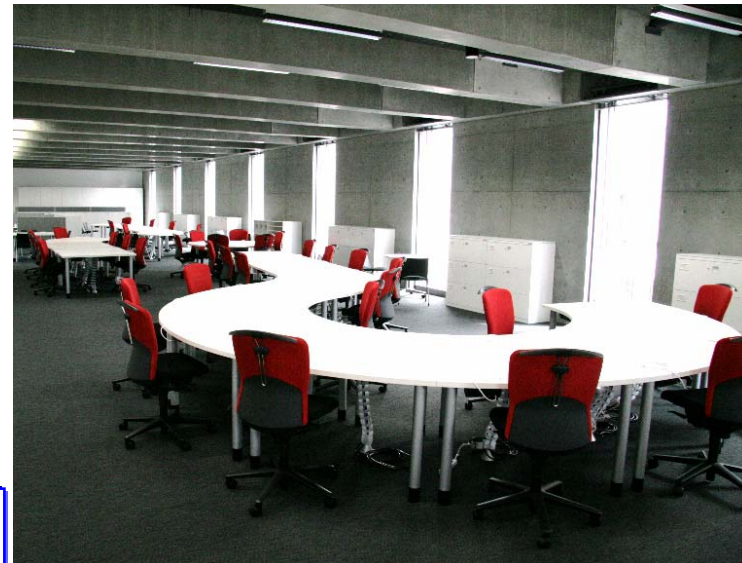
建物内の執務空間