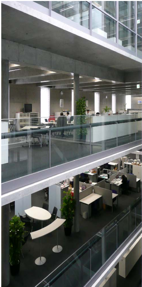
エコボイド(吹き抜け)