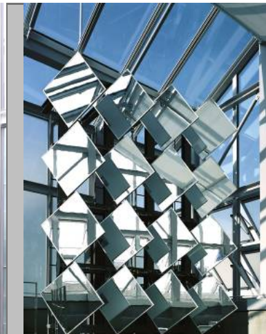
吹き抜け最上部の、 太陽自動追尾 反射ミラー