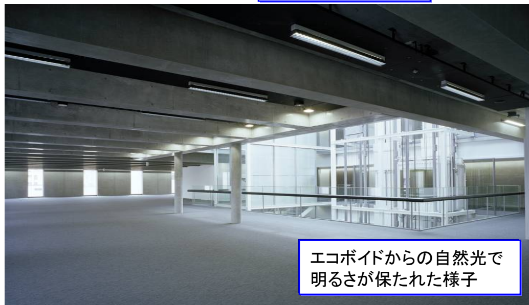
エコボイドからの自然光で 明るさが保たれた様子