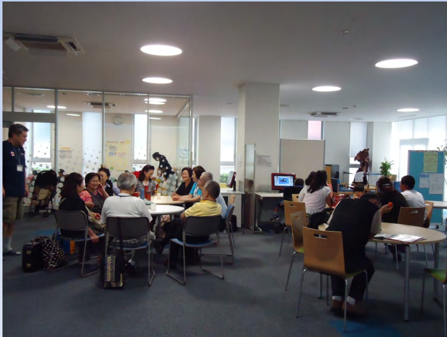
避暑地(ふれあい館)を利用するみなさん