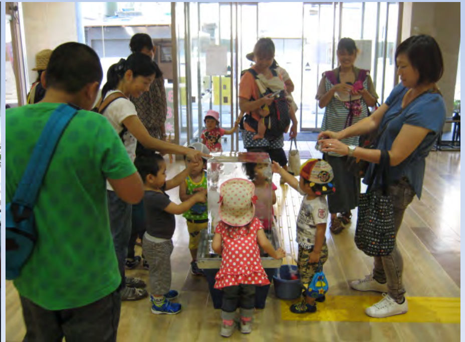
避暑地の氷柱イベントに集まったみなさん