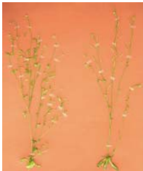
図3 BOR1 を過剰発現するシロイヌナズナはホウ素欠乏での生育が改善する。野生型のシロイヌナズナ（左）と BOR1 を過剰発現する形質転換シロイヌナズナ（右）を低ホウ素条件（0.5 μM のホウ酸）で水耕栽培したもの。左の野生型のシロイヌナズナでは結実がみられないが、右の過剰発現体では結実している。