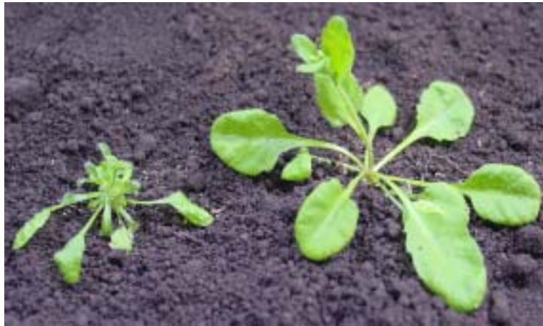
図1 シロイヌナズナの bor1-1 変異株 (左) 野生型のシロイヌナズナ (右) を低ホウ素条件で栽培したもの。変異株は地上部の生育が劣っている。ホウ素を十分に与えると、両者は同様の生育を示すようになる。

開発によって、植物の生産性を高めたり、微生物を用いて、ホウ酸の除去を行なうなどの効果が期待される。本研究では、これらの目的に対して以下に述べるような一定の成果を挙げることができたと考えている。