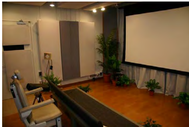
図 2 システム校正・臨床評価用シミュレータ用として 国立精神・神経センターに構築したブース

また、システム校正を行うためには、薬剤を用いずに視聴覚情報によって被験者の基幹脳機能を変動させてデータをサンプリングし、情報入力に対する基幹脳の応答特性を捉える必要がある。そのために、本研究グループが発見したハイパーソニック・エフェクト(人間の可聴域上限をこえる超高周波成分を豊富に含む複雑な音が基幹脳を活性化する現象)を応用する。ハイパーソニック・エフェクトの基幹脳活性変動効果を十分に発揮するために必要な、150kHz以上に及ぶ超高周波成分に対する特性を大幅に改善したスピーカを設計し試作を開始した。またシミュレータの特性調整用に、基幹脳機能モニタに必要な十分な時間を反復なしにカバーすることの可能な時間長を備え、基幹脳活性を変動する効果をもった音響映像ソフトウェアの試作を行った。さらに PET 装置を低拘束度化するための基本設計を終え、前倒しで試作に入った。