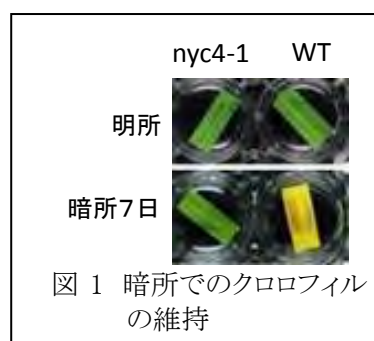
図1 暗所でのクロロフィルの維持

ステイグリーン遺伝子の網羅的単離を目指し、シロイヌナズナの EMS 変異株、FOX ライン、CRES-T ライブラリーのスクリーニングを行った。その結果多数のステイグリーン株を単離でき、その一部については遺伝子の同定などを行った。単離された変異株のうち、イネの nyc4 と名付けたステイグリーン株の原因遺伝子は、シロイヌナズナ THF1 のオルソログであった 7) 。この株は、クロロフィルを保持するだけでなく、光化学系 II サブユニットの分解が抑制され、その結果光化学系 II の活性も維持されるステイグリーン株であった。また nyc4 は圃場条件下で葉の枯れ上がりが遅いこともわかった。その他のステイグリーン株においては遺伝子の同定等を進めている。シロイヌナズナの nyc1 変異株の種子発芽における機能解析もおこなった 3) 。