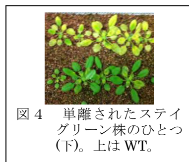
図4 単離されたステイグリーン株のひとつ (下)。上は WT。

様々な変異プールのスクリーニングにおいて、興味深いステイグリーン株がいくつか単離された。まだ同定されていないステイグリーン関連遺伝子は多く存在すると考えている。スクリーニングを進め原因遺伝子の同定をさらに進めることが必要である。また、光合成の改変に伴う傷害を、少なくとも部分的には、回避することができた。これは、品質管理の重要性を示すと同時に、作製した形質転換株の傷害回避が可能であることを示唆している。安定で強力なステイグリーン株の作製には、未知のステイグリーン関連遺伝子の単離と、傷害を防ぐため品質維持機能の強化が必要である。また、他の植物にも応用展開することも重要な課題である。