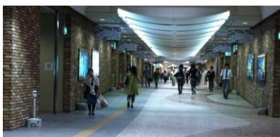
図1. Diamor 大阪

街角の状況認識については「流れ」、「グループ」、「集まり」などの街角の状況の認識を目指している。基本的には広域での人位置計測を必要とするが、効率的に研究プロジェクトを進めるために、上記の3次元計測可能なセンサの開発を待つことなく、街角の状況認識についての研究を開始した。大阪市内の地下街であるDiamor大阪(図1)と、商業施設ATCの2か所で人の通行データを計測し、データを蓄積した。Diamor大阪では6時間の通行データを4日分、ATCでは6時間の通行データを6日分蓄積した。これらの蓄積データをもとに、来年度以降に流れ検出のアルゴリズムの研究を開始することが可能になった。