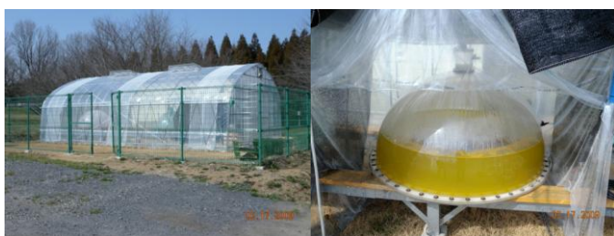
図2 屋外培養器用ビニールハウス(左)大量培養テスト運転(右)

(2)各種モニターパラメータの確定と計測モニター系概念設計では、試験プラント(図2)において将来のプラント運転のモニターとして、pH、酸化還元電位、溶存酸素、二酸化炭素量、日照などの同時測定、通年測定を行えるシステムの検討を行った。