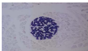
膵内分泌に特異的