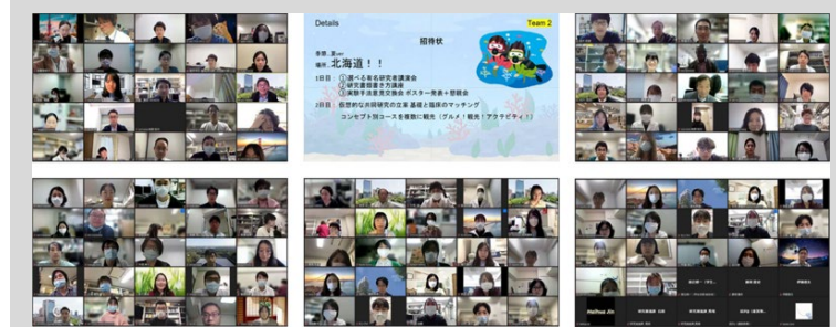
2021年度オンライン研究成果発表会