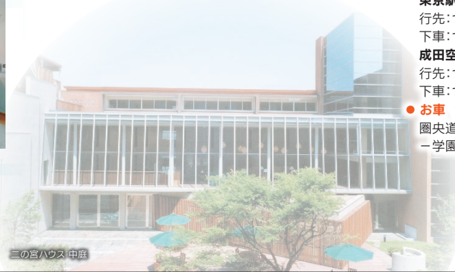
二の宮ハウス 中庭