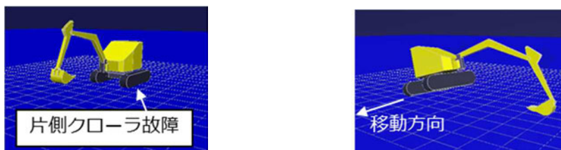
図4 機能縮退手法による移動 (左: ロボット, 右: 腕と残存したクローラを用いた移動)