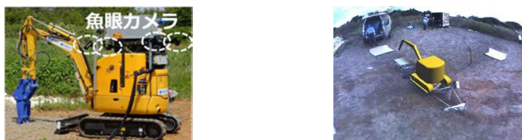
図1 俯瞰画像 (左: ロボットに搭載したカメラの配置, 右: 任意視点俯瞰画像)

研究計画(3)に関して、ロボット故障時に、残存機能を用いてパフォーマンスを維持するための強化学習による機能縮退手法を提案し、シミュレーション上で動作を確認した(図4)。