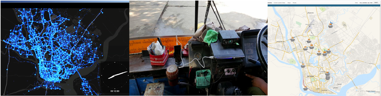
図1左：MPT社提供のCDRデータからヤンゴン市内の人の流動状況を再現したもの。図1中央：バスに設置したスマートフォン。図1右：予備実験で走行したバスデータの状況