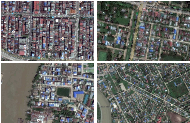
図2 地域による地域特性および建物特性の把握