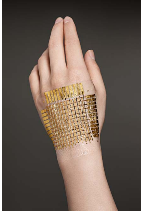
図3 人の手に貼ったセンサーシート

センサーシートは大変にしなやかであり、手のしわのような複雑な表面の形状に追従して、ぴったりと密着させることができる。