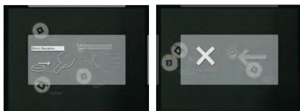
図3 モード切替時に表示される画面（左）と行動のキャンセル時などに表示される画面（右）

FTIR (Frustrated Total Internal Reflection)[3]を利用する。本方式では赤外光がアクリルパネル内で全反射し、接触した面のみ反射率が変わってディスプレイ下の赤外カメラから塊(Blob)として認識できる仕組みとなっている。