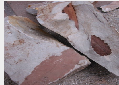
神戸層群の植物化石観察