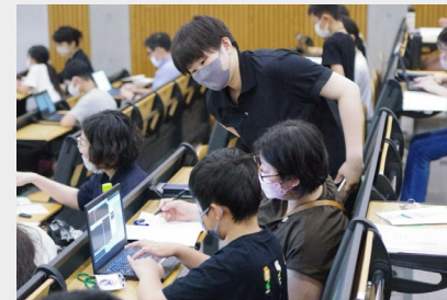
▲学生メンターによるフォロー