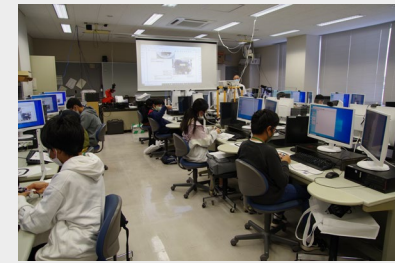
▲連携機関での講義の様子