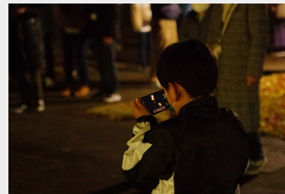
▲天体観測会の様子