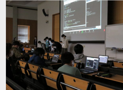
▲チームでの中間発表会