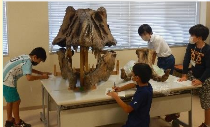
基礎/理科 (生物・地学) コース講座