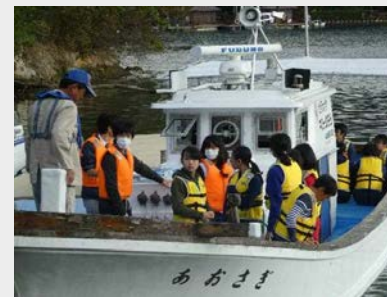
第1段階：合宿（海洋実習）