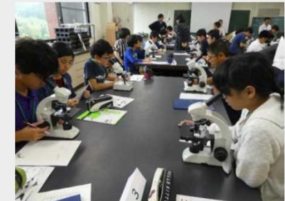
第1段階：基礎科目（生物）