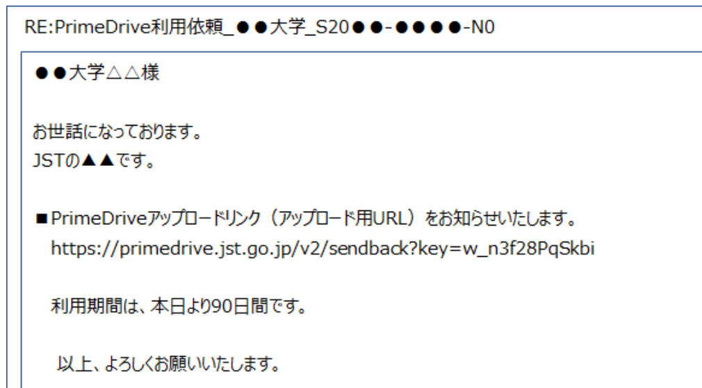
図 2 アップロードリンク通知メール（イメージ）

※利用期間は、JST からのお知らせより【90 日間】になります。期間内は同じアップロードリンク、パスワードで何度でもファイルのアップロードが可能ですので、利用毎の依頼は不要です。2 度目以降は、ファイルアップロード後にその旨ご連絡ください。